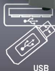
Carico/scarico dei dati e programmazioni