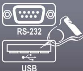
Scanner (alimentato dalla bilancia)